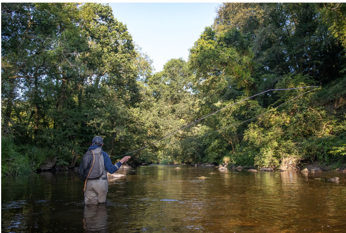
Pêche en wading ouvrira le 13 avril 2024