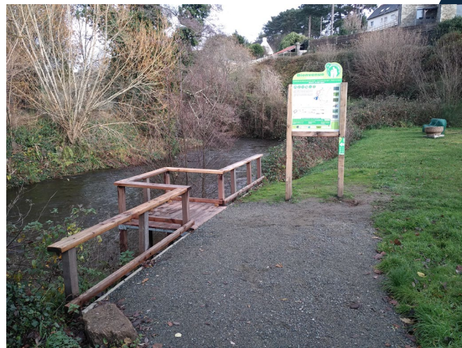
Pêche sur le Léguer à Belle isle en Terre