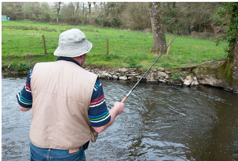
Pêche au TOC sur le Lié

Sondage 2024 – Techniques de pêche de la truite plébiscitées par les pêcheurs des Côtes d'Armor