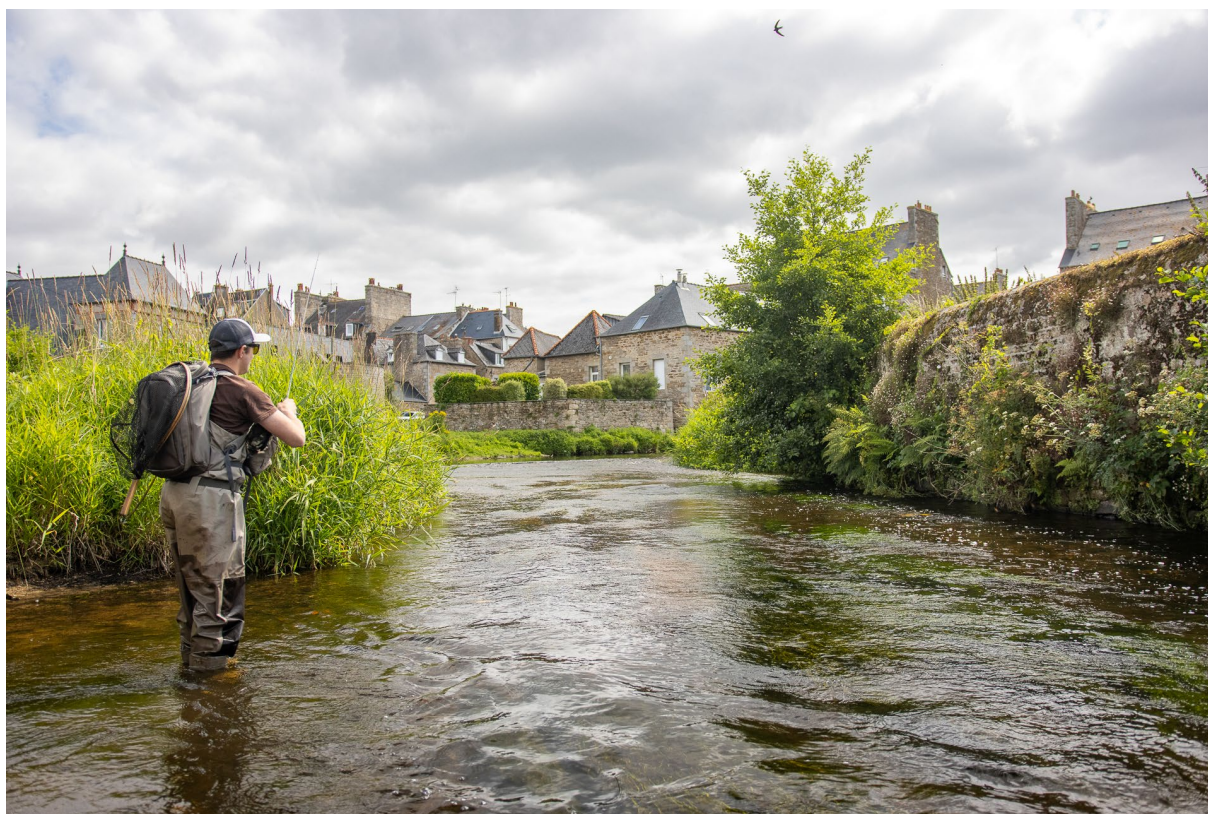
Pêche sur le Trieux, photo P Rigalleau ARPB

Le 9 mars prochain, c'est l'ouverture de la pêche en 1 ère catégorie, pour les initiés, la première en catégorie signifie la pêche en rivière où la truite fario est le poisson roi. Journée très attendue par les amateurs, elle marque le lancement de la saison 2024.